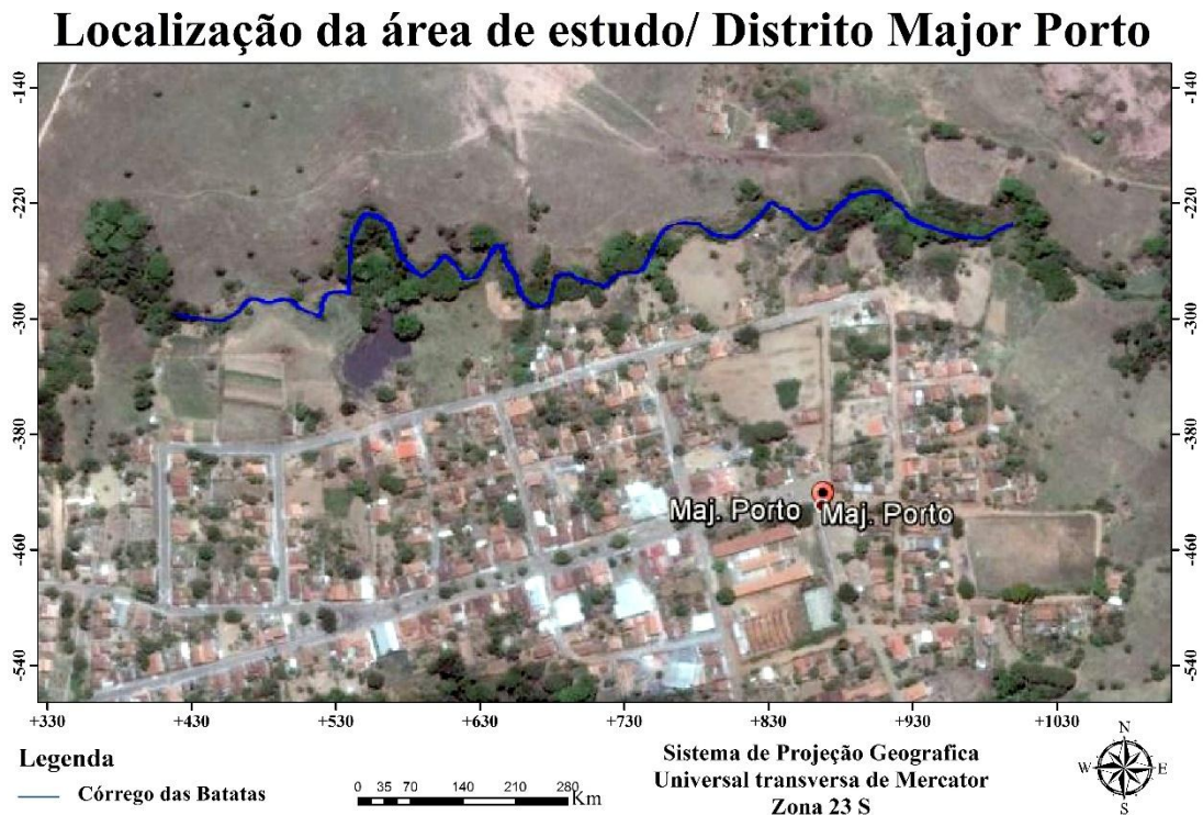
Figura 1: Planta de localização do curso d'água estudado.

encontra-se na bacia hidrográfica federal do rio São Francisco e está inserida na sub-bacia estadual do rio Abaeté. De acordo com Classificação de Koppen, o local de estudo apresenta clima tropical chuvoso, sendo classificada como Aw. A Figura a baixo demonstra o local de estudo.